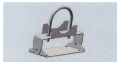
Drška sa gibljivim zglobovima